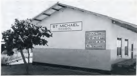
ST. MICHAEL BASISCHOOL (S.K.O.A.): de tekst op het bord spreekt voor zichzelf.

Het zal duidelijk zijn dat een grondrecht niet altijd absoluut geldig kan zijn. De vrijheid van onderwijs bijvoorbeeld gaat niet zover dat het geven van onderwijs in het openbaar aanleiding mag zijn tot versterking van de openbare orde. Beperkingen van grondrechten zullen nodig zijn, zowel om excessen tegen te gaan als om ervoor te zorgen dat zij niet in de verdrinking komen. In de Staatsregeling worden eventuele beperkingen echter uitdrukkelijk in het betreffende artikel vermeld. Het onderwijsartikel kent in lid 2 een tweetal beperkingen. De eerste, hiervoor reeds genoemd en die het gehele bijzonder onderwijs raakt, betreft het toezicht van de overheid op het onderwijs. Met deze beperking beoogde de wetgever om voorzover nodig de rechtsorde te beschermen tegen de mogelijke gevolgen van een met de staatsbeginselen strijdig onderwijs. De tweede beperking betreft het onderzoek door de overheid naar de bekwaamheid en zedelijkheid van de onderwijzers. In tegenstelling tot de eerste heeft deze beperking een positieve bedoeling: en wel gericht op een zinvol en op de huidige maatschappelijke verhoudingen afgestemd gebruik van